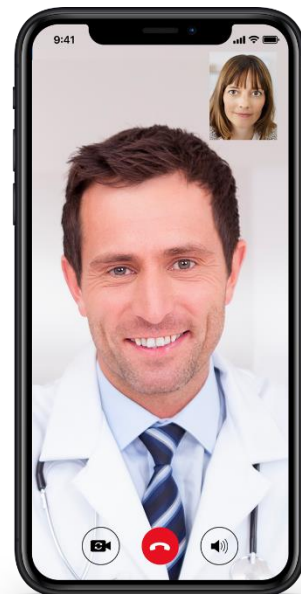
Abb. 2 Videosprechstunde

Die Videosprechstunde in der PraxisApp „Mein HNO-Arzt“ steht aktuell nur den eigenen Patienten zur Verfügung. Fremde Patienten können diese App nicht nutzen. Um die Videosprechstunde nach den Vorgaben der KBV zu zertifizieren, muss diese Funktion für alle Patienten verfügbar sein. Wir haben einen Weg gefunden, um diesen unterschiedlichen Anforderungen gerecht zu werden und befinden uns bereits in der Vorbereitung